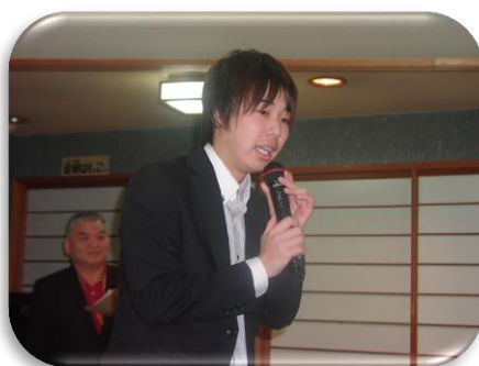
クリエイト久保田氏の挨拶