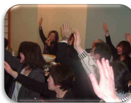
〇×クイズは大盛り上がり！！